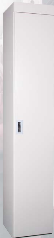
ガーベラ エキストラボックス