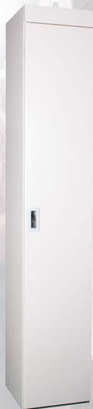
ガーベラ エキストラボックス