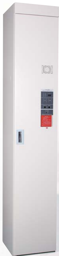
ガーベラ パッケージ