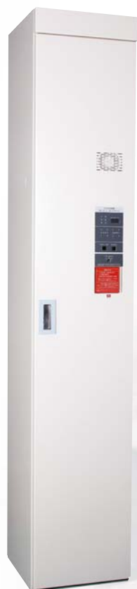
ガーベラ パッケージ