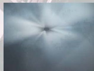
消火剤放射の様子