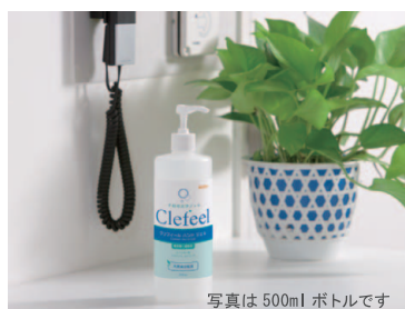
写真は 500ml ボトルです