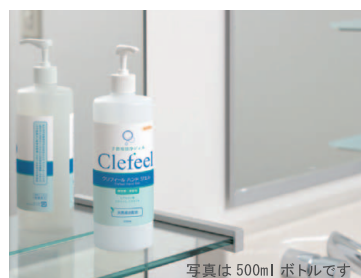
写真は 500ml ボトルです